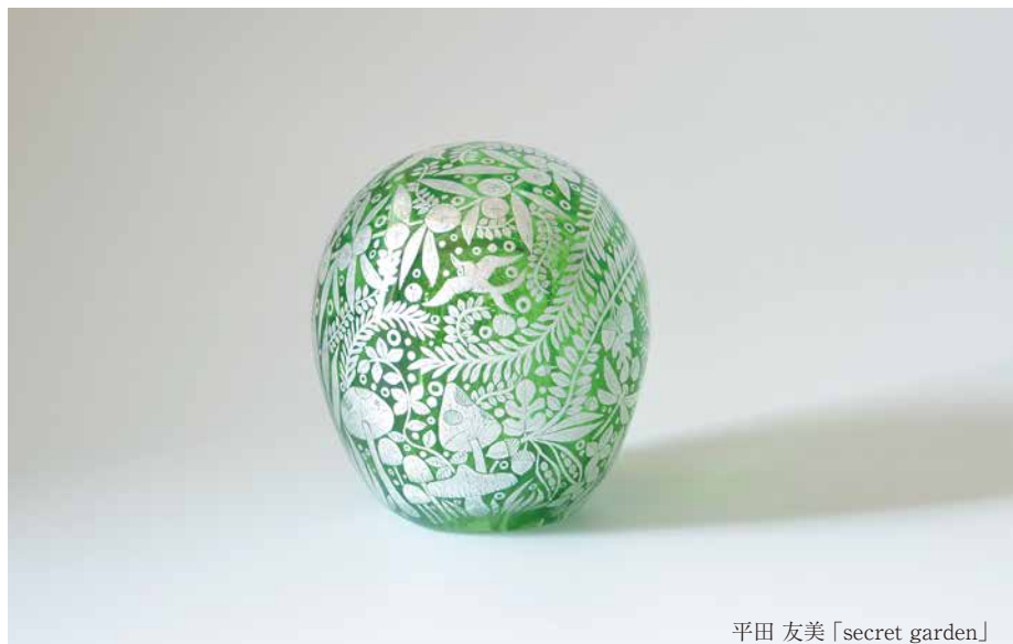
平田 友美「secret garden」