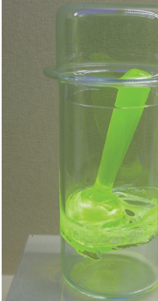
本郷仁「夢のあとさき-内包-」