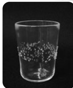
◇透明ガラスの吹きガラス体験、サンドブラスト、リユーター体験も同時開催しています。